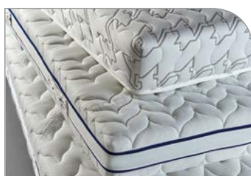
■ 매트리스 등 가구제품