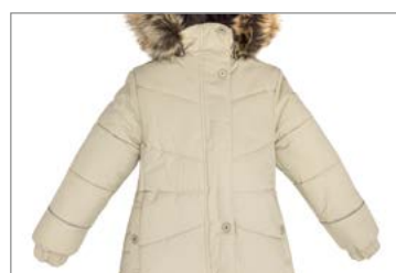
■ 패딩 의류