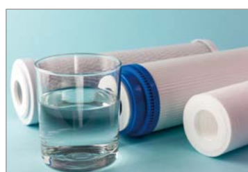
■ 정수기 필터