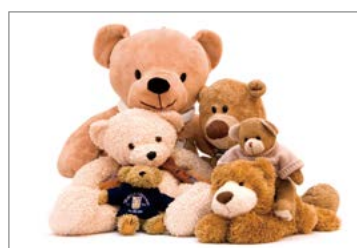
■ 봉제 완구